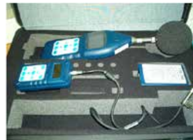
Sonómetro e Dosímetro