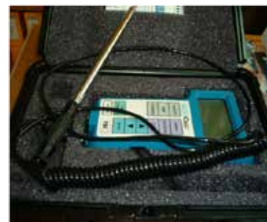
Medidor de Conforto Térmico