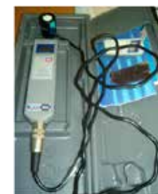
Bomba de Aspiração